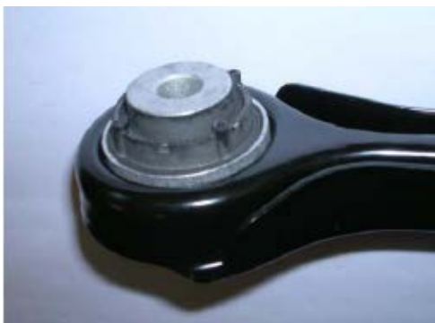
Fertiger Querlenker (verzinkt und beschichtet) mit eingepresstem Lager

Der Automobilhersteller verlangt für seine Qualitätssicherung eine Mindestauspresskraft von 5,5 kN. Darüber hinaus soll die Auspresskraft keine großen Schwankungen aufweisen. Berechnen Sie die Auspresskraft! Welche Haupteinflussfaktoren für die Auspresskraft können Sie identifizieren?