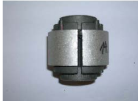
Einseitig geschlitztes Gummi-Metall-Lager mit gestrahlter AlMg3-Oberfläche