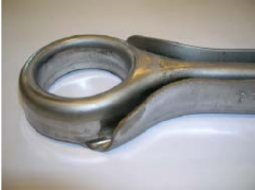
Querlenker mit Blechdurchzug (unbeschichtet)