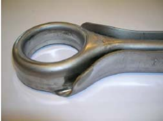
Querlenker mit Blechdurchzug (unbeschichtet)